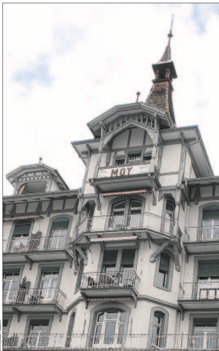
Der Turm des ehemaligen Hotels Moy in Oberhofen: Im Turm ist der Einbau einer Natelantenne geplant.